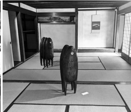
アートガーデン 2024 夏 会場風景